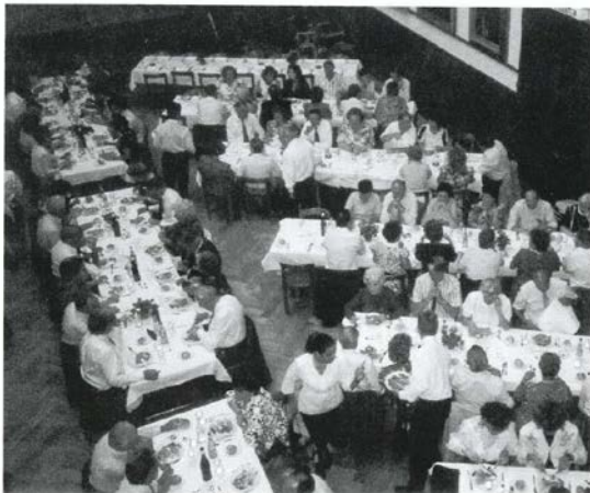
Une assemblée bien achalandée, pour faire honneur aux 60 ans du Hauteville.

La suite du programme ferait pâlir de jalousie le fêtard le plus avide de réjouissances; dans une salle des Rois magnifique et chargée d'histoire, on eu droit aux discours vivants des instances dirigeantes, un repas pantagruelique avec jambon cru des Grisons, feuillantine de foie de volaille, filets mignons aux bolets, délices de la ferme et, pour finir en beauté, sorbet arrosé de williamine! Le tout copieusement garni de vins choisis avec soin et servis à volonté. Service impeccable, repas merveilleux, ambiance chaleureuse, participants de qualité, le tout fut digne d'une grande réception princière; et chacun s'en rendit compte, d'ailleurs, comme en témoigna la mine réjouie de tous les joyeux drilles réunis par le Hauteville-Sports.