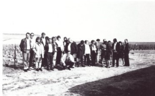
Groupe de participants dans le vignoble, à Epernay.