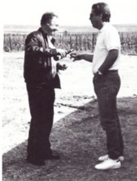
Notre président et vice-président en pleine séance de travail. Dur ! Dur !