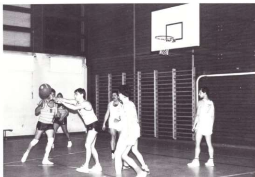
Christophe Marchisio à la passe.