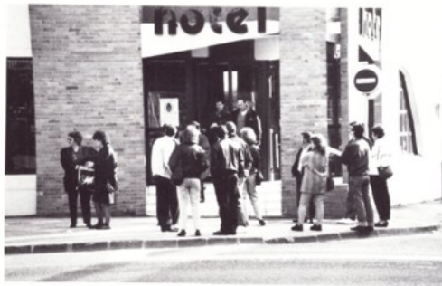
Arrivée à l'Hôtel FIMOTEL samedi en fin d'après-midi, après un voyage en car et sans problème.