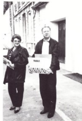
Et toujours le même avec le ravitaillement pour le chemin du retour.