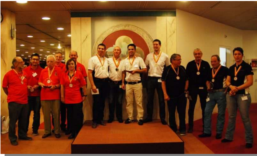
Hauteville 3 sur le podium du groupe B (2 e )

Durant tout le 2 e tour, le classement des équipes de tête (Aprotec 1 er , Givaudan 2 e et nous 3 e ) n'a pas changé, jusqu'au match de défense de position. C'est lors de celui-ci que nous avons réussi à passer l'épaule et coiffer Givaudan sur le fil. Nous terminons donc cette saison 2014 sur la 2 e marche du podium. Nous demeurons 3 e quant au nombre de quilles abattues.