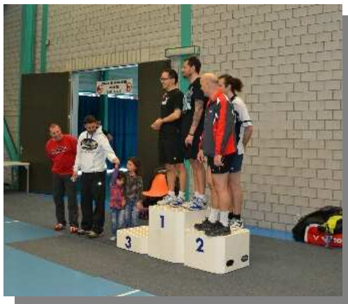
Podium du double messieurs non licenciés