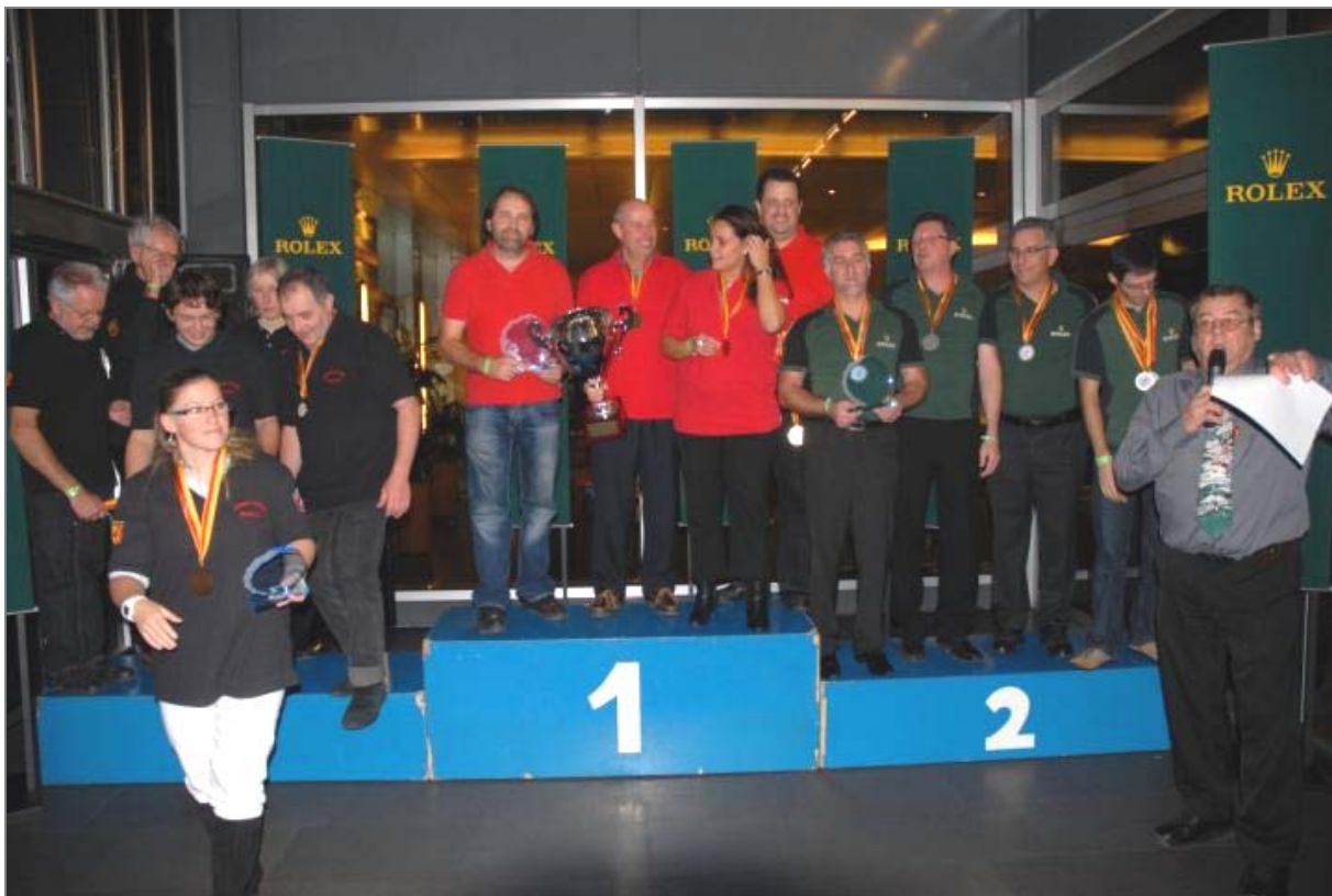
En rouge, l'équipe de Hauteville 1

Je remercie l'ensemble des joueuses et joueurs pour leur excellent niveau de jeu durant l'année 2011. Cette année 2011 fut une année exceptionnelle et indécise jusqu'au dernier match gagné contre Rolex 1. Nous avons terminé, pour la 8 e année consécutive, à la 1 re place en catégorie A. Hauteville 1 s'est donc qualifiée pour les championnats européens de bowling corporatif à Bruxelles en 2012.