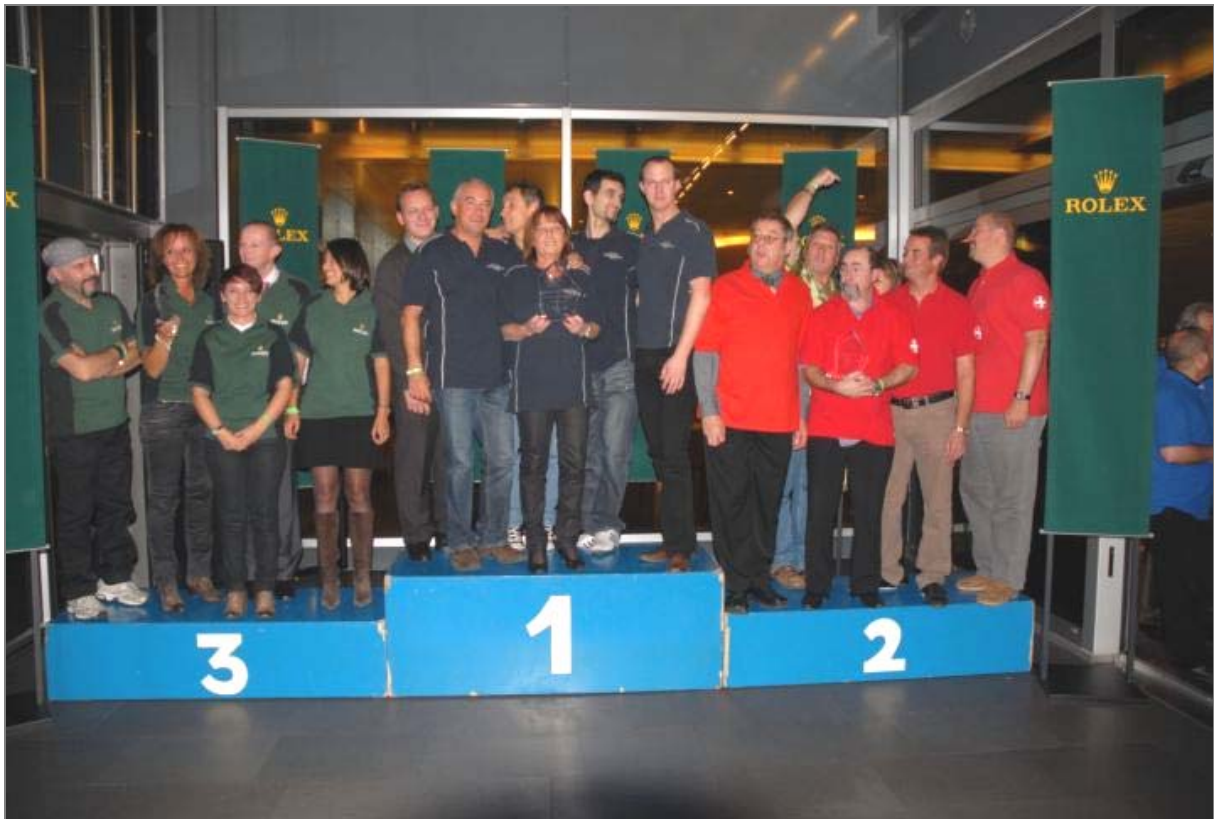
En rouge, l'équipe de Hauteville 4