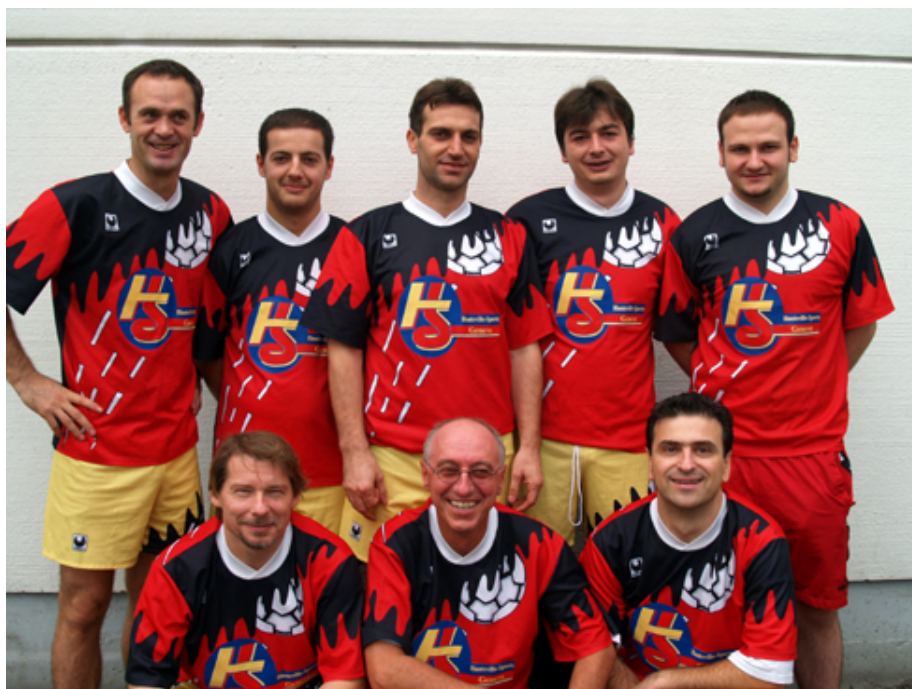
Une partie de l'équipe du FC Hauteville au 27 ème tournoi en salle, organisé par l'AGFC

Le tournoi a été gagné par le FC Frank Muller qui a aussi obtenu le prix « Meilleure défense ». Le FC Hauteville a terminé à la dernière place de son groupe. Malgré cela, la bonne ambiance et la sportivité étaient au rendez-vous.