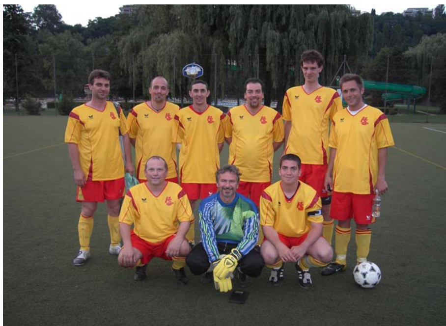
Une partie de l'équipe du FC Hauteville, à la Fontenette, avec le nouvel équipement

Une agréable surprise attendait notre équipe pour les deux derniers matchs du championnat. En effet, le FC Hauteville a pu porter le nouvel équipement avec, comme à l'accoutumé les couleurs prédominantes du drapeau genevois.