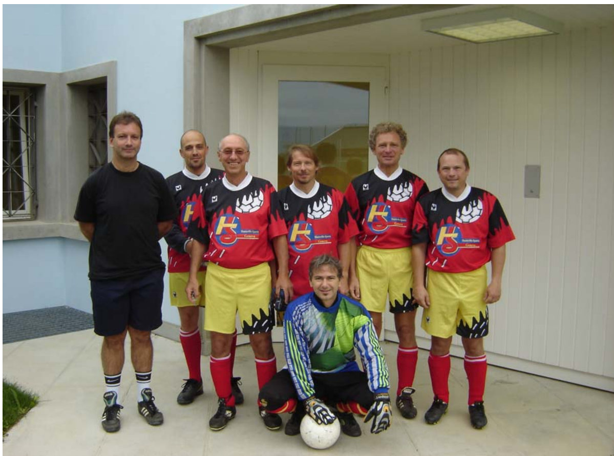
Rencontre de l'année dernière contre les mineurs de la Clairière